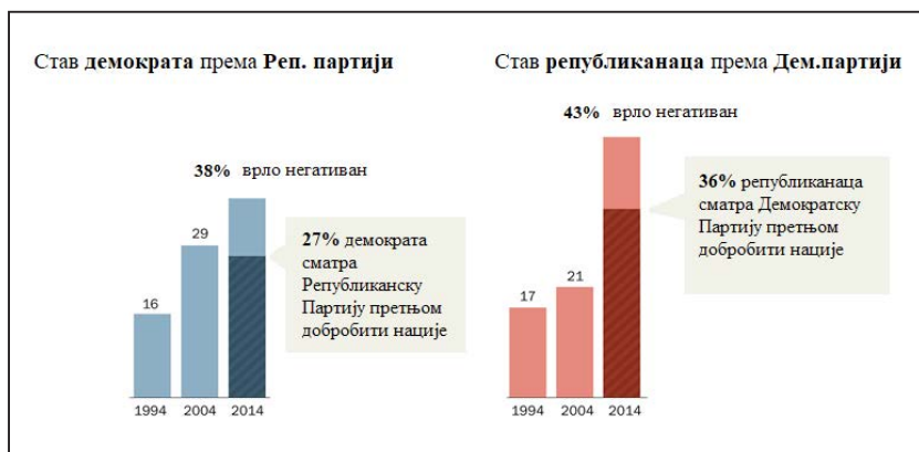
Графикон 1: Међусобне негативне перцепције Демократа и Републиканаца