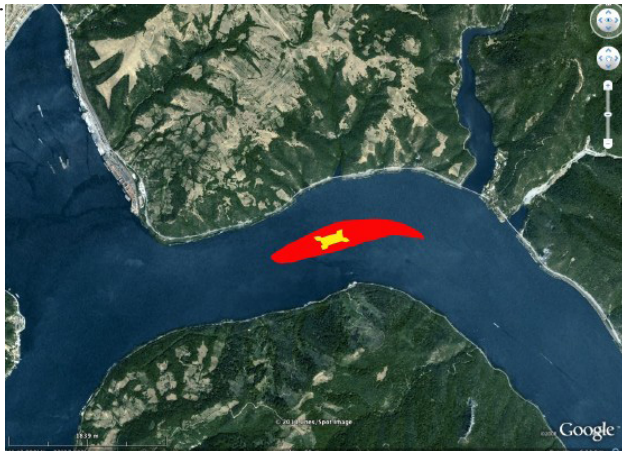
ФОТОГРАФИЈА ИЗ ВАЗДУХА ПОТОПЉЕНОГ ОСТРВА АДАКАЛЕ. 18