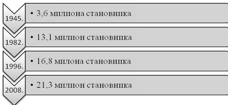
Графикон 1. Раст укупне популације Аутономне области Синђанга

Извор: Anthony Howell, C. Cindy Fan, Migration and Inequality in Xinjiang: A Survey of Han and Uyghur Migrants in Urumqi , Eurasian Geography and Economics, No.1, 2011, p. 123