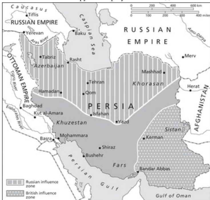
Мапа 1. Англо-руски споразум из 1907. године 4

истом принципу продубљивати сарадњу са заливским монархијама, а нарочито након завршетка Другог светског рата када склапају савез са Саудијском Арабијом којој пружају безбедносне гаранције осигуравајући сигурно и повољно снабдевање нафтом, доминацију долара у светским финансијским токовима и војно присуство у региону.