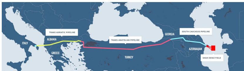
Мапа 2. Траса Јужног гасног коридора